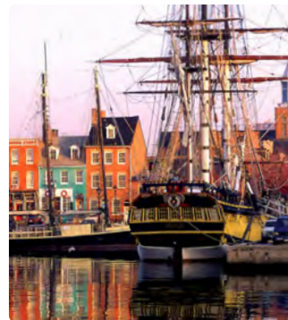
Fells Point, Baltimore

www.dcr.virginia.gov/state-parks/first-landing