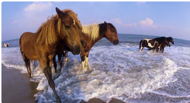
Assateague Island Ponies

Tag 3/4 > Die Historic National Road Scenic Byway führt Sie durch diesen Teil von Maryland und zu Ihrem nächsten Halt: Gambrill State Park. Dieser liegt in den Bergen der Catoctin Mountains in Frederick County. Genießen Sie einen atemberaubenden Bergblick von drei Aussichtspunkten sowie kilometerlange Wander-, Rad- und Reitwege. 75 Meilen bis zum Gambrill State Park ★ Weitere Sehenswürdigkeiten in der