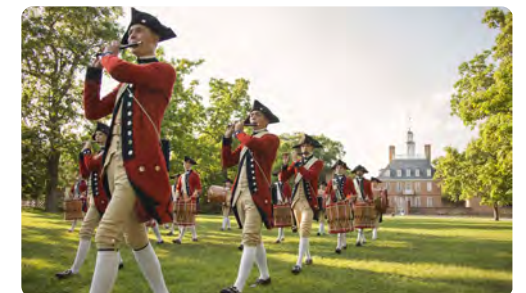
Fife and Drum Corps im kolonialen Williamsburg

Schwarzbären auf Ihrer 105 Meilen langen Fahrt entlang des Skyline Drives bis nach Front Royal.