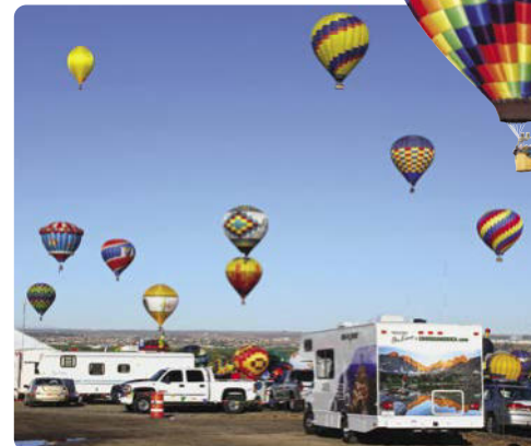
Das Heißluftballonfestival, Albuquerque

Tag 9 > 95 Meilen bis zum Grand Canyon Nationalpark ★ Es gibt so viele Möglichkeiten den Grand Canyon zu erleben – per Wanderung hindurch, am Rand entlang oder per Helikopter Rundflug darüber. 🌐 www.nps.gov/grca/planyourvisit/cg-sr.htm