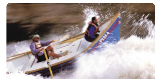
Adrenalin pur auf dem Colorado River