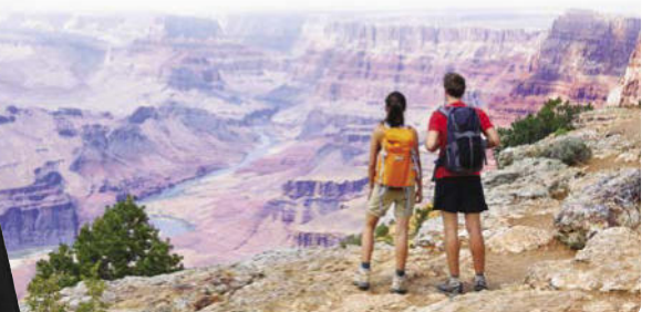
Toller Ausblick über den Grand Canyon