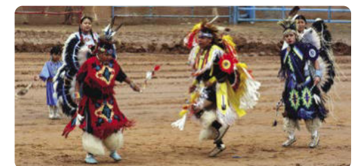
Tanz der Ureinwohner