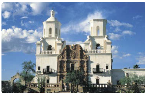
Mission San Xavier del Bac, Tucson

Tag 3 > Heute erwartet Sie eine etwas längere Fahrt von knapp 3 Stunden auf der Interstate 10. Auf der Route bietet sich ein Stopp im historischen Bowie an (1880 ist in den USA historisch!!) just